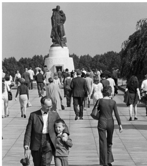
Die Gedenkanlage im Treptower Park in den 1970er-Jahren: Ein beliebter Ausflugsort der Berliner

Seit März 2022 war es damit schnell vorbei: Die "Zeitenwende" nahm das Museum in ihren Besitz. Kontakte mit russischen staatlichen Stellen beschränkte er nur aufs Nötigste (schriftlich im Rahmen des Museumsbeirats). In Interviews und öffentlichen Auftritten stichelte der Gedenkexperte gegen Russland, bezichtigte es der Propaganda und des Missbrauchs der Geschichte für "Eroberungskriege".