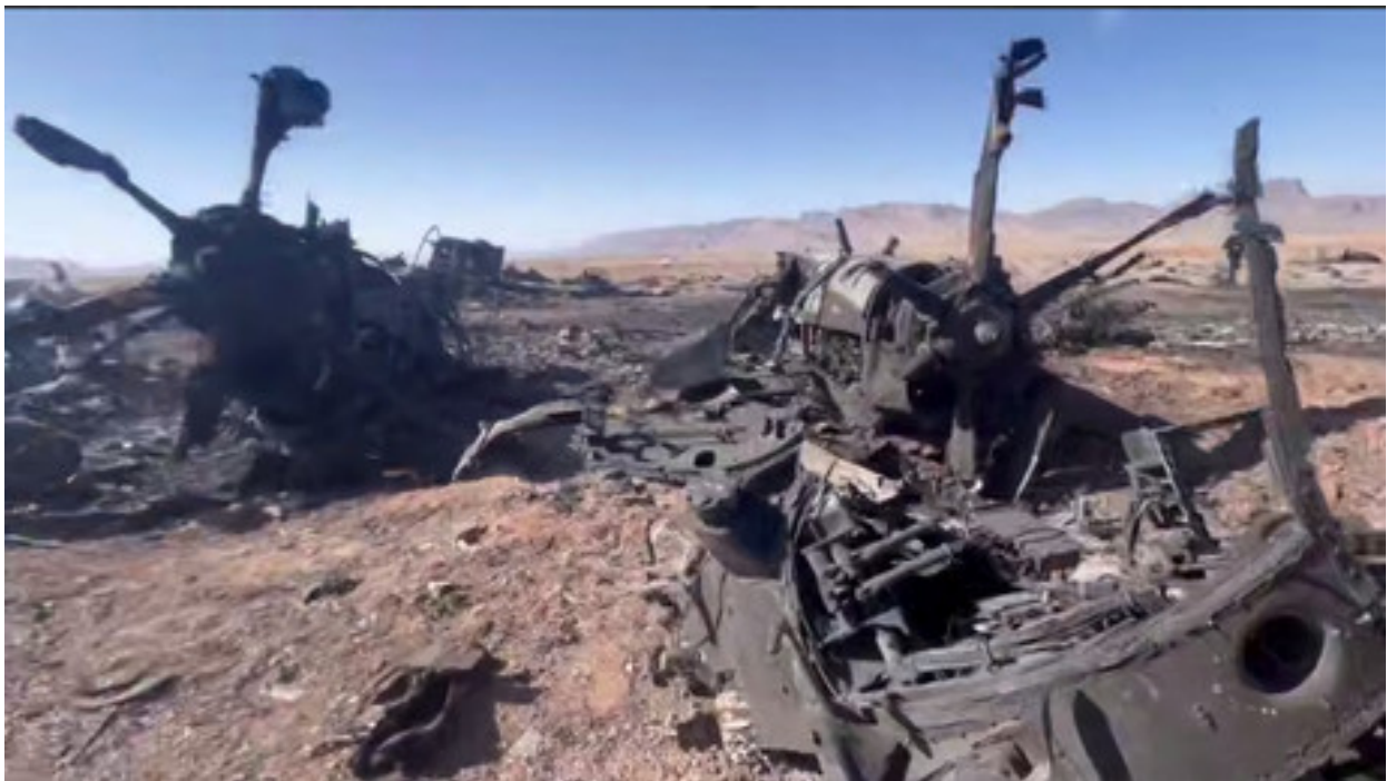
Überreste einer der C-130

Es ist eine Hypothese, die zumindest erklärt, warum US-Präsident Donald Trump derzeit noch verrückter erscheint als ohnehin schon, und warum seine Ausbrüche immer grenzenloser wirken: Was, wenn die Rettungsoperation keine war, sondern ein gescheiterter Einsatz?