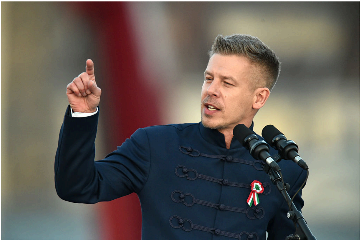
Peter Magyar hält eine Rede bei einer Kundgebung der Tisza-Partei in Budapest (15. März 2026)

Magyar, ein ehemaliges Mitglied der Fidesz, trat 2024 aus Orbáns Partei aus und schloss sich der Tisza an, einer Partei, die seit ihrer Gründung vier Jahre zuvor in der Versenkung verschwunden war. Während er in zwei Gerichtsverfahren verwickelt war – in einem sagte er über mutmaßliche Korruption in Orbáns Regierung aus, im anderen wurde er von seiner Ex-Frau, der ehemaligen Justizministerin Judit Varga, der häuslichen Gewalt beschuldigt –, wurde Magyar in jenem Jahr zusammen mit sechs weiteren Tisza-Abgeordneten ins Europäische Parlament gewählt.