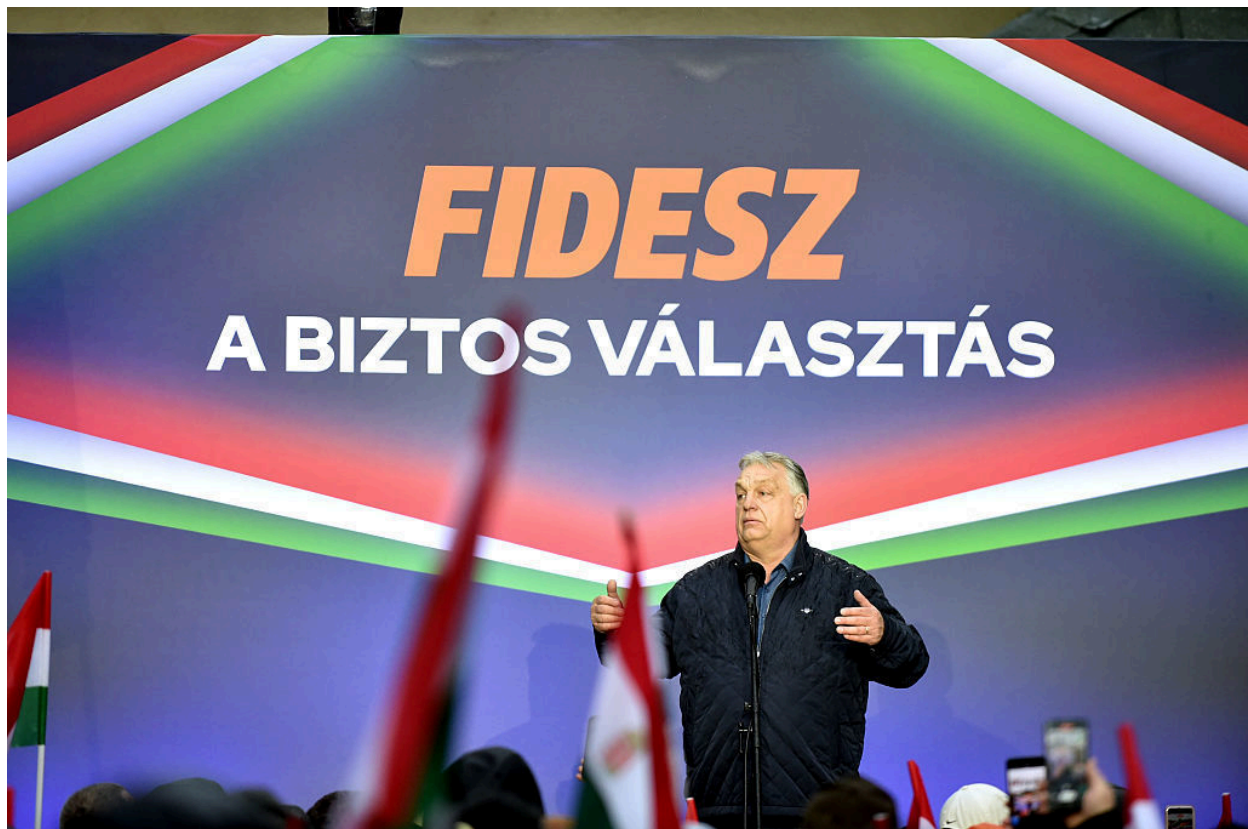
Viktor Orbán spricht bei einer Wahlkampfveranstaltung in Pecel (28. März 2026)

Mehr als ein Dutzend Parteien haben Kandidaten aufgestellt, doch die Wahl ist im Wesentlichen ein Duell zwischen zwei Parteien: Orbáns Fidesz und Péter Magyars Tisza.