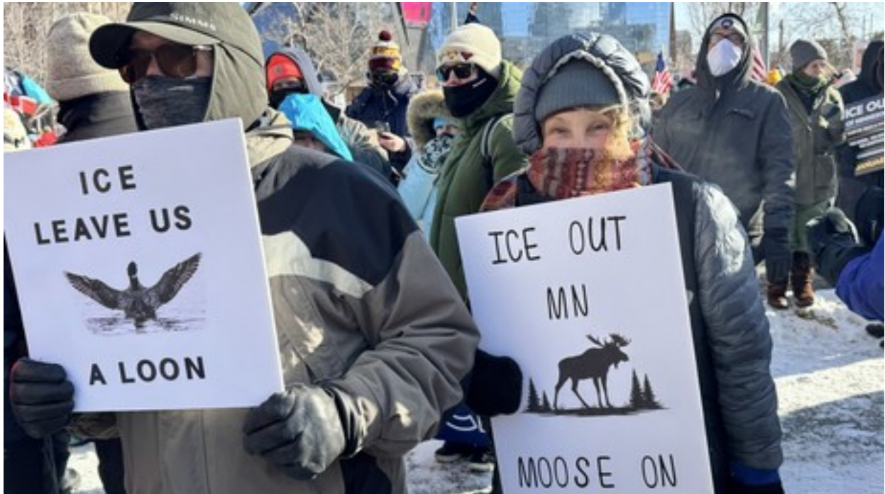
Proteste in Minneapolis, 24.01.2026

Was kommt heraus, wenn man vehemente Abschiebungen mit einem Farbrevolutionsschema kreuzt? Wenn man jede zweifelhafte Handlung zum Meme macht? Minnesota ist ebenso undurchschaubar wie potenziell explosiv. Masseneinwanderung ist da nur der Aufhänger.