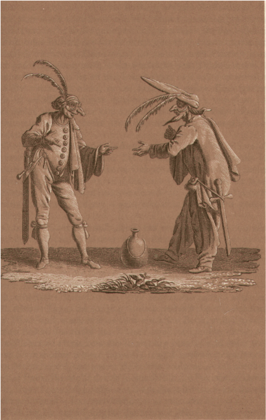
nach Callot von Shuels in Berlin